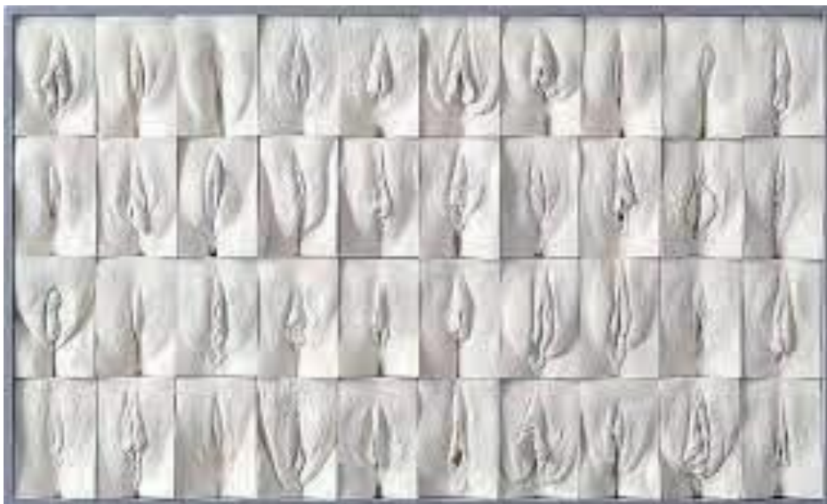
Jamie McCartney, The Great Wall of Vagina (2008).

Ο/Η εκπαιδευτικός ολοκληρώνει τη δραστηριότητα παρουσιάζοντας το έργο τέχνης του Jamie McCartney « Γυναίκες από όλο τον κόσμο », ηλικίας από 18 έως 76 ετών. Περιλαμβάνει μητέρες, κόρες, μονοζυγωτικά δίδυμα, τρανσέξουαλ άνδρες και γυναίκες, μια γυναίκα πριν και μετά τον τοκετό, καθώς και μια άλλη πριν και μετά την αιδουιοπλαστική».